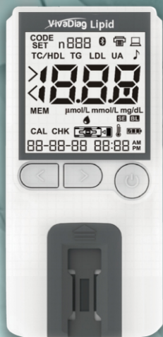
MEDIDOR DE LIPIDOS